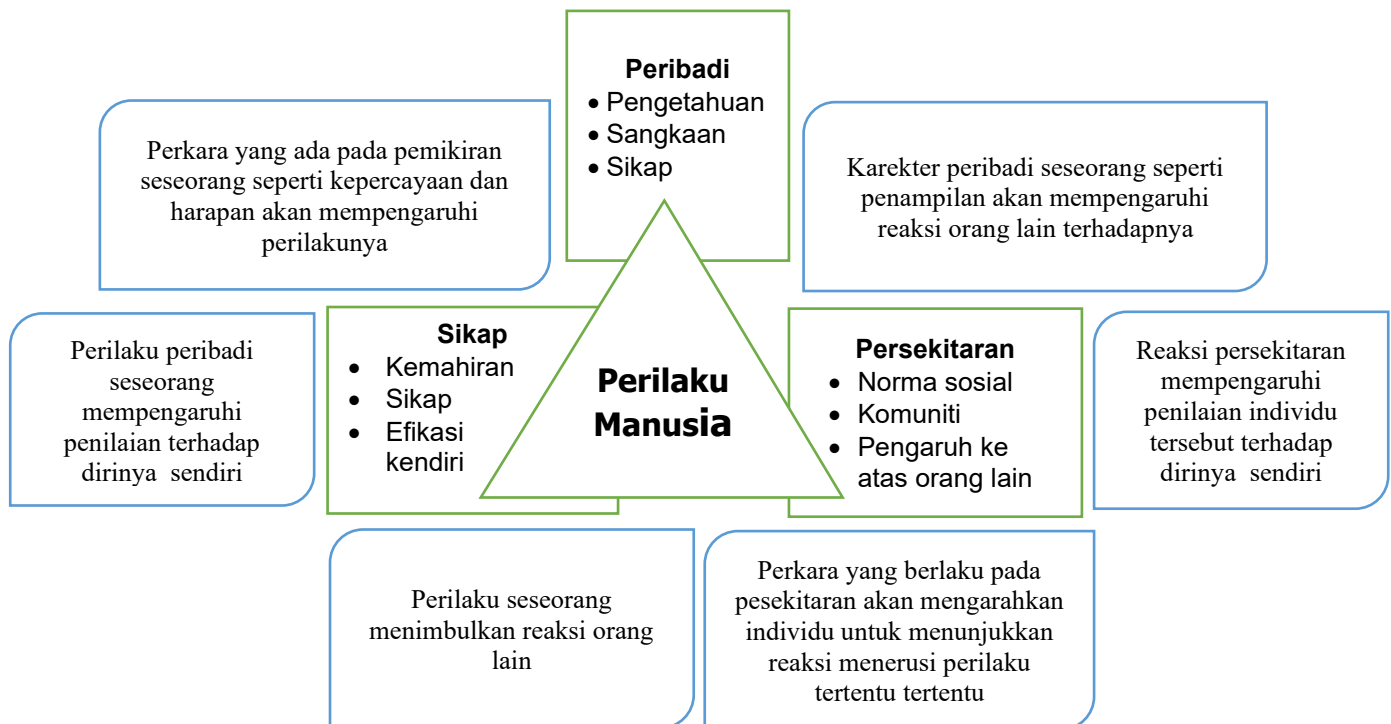
Rajah 2: Huraian Teori Sosial Kognitif Bandura

Gabungan antara kerangka pendidikan Islam dan teori sosial Bandura membolehkan kita melihat bahawa penghayatan akhlak remaja terbentuk melalui interaksi dinamik antara faktor dalaman dan luaran. Faktor dalaman seperti iman, niat dan disiplin sendiri menjadi asas yang mengukuhkan jati diri remaja manakala faktor luaran seperti keluarga, sekolah, komuniti dan media menjadi ruang yang mempengaruhi dan menguji kekuatan dalaman tersebut. Dengan meletakkan kedua-dua teori ini sebagai kerangka konseptual, kajian ini menekankan bahawa pembentukan akhlak yang mantap tidak akan berlaku jika hanya bergantung kepada satu aspek sahaja. Sebaliknya, pendidikan akhlak perlu bersifat menyeluruh, menekankan pembangunan dalaman individu serta menyediakan persekitaran luaran yang kondusif untuk memperkukuh penghayatan nilai dalam kehidupan seharian remaja.