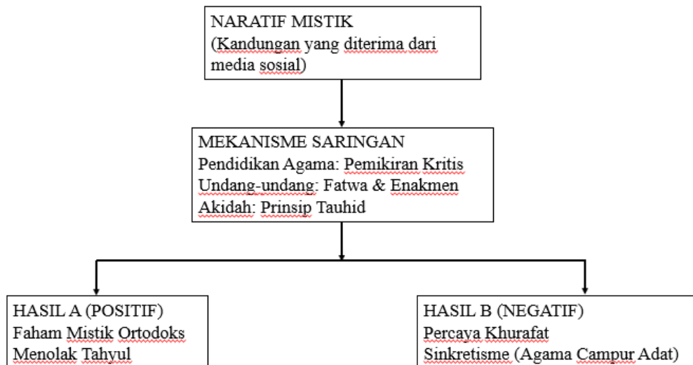
Rajah 2: Mekanisme Penyelesaian (Fasa Solusi)

semasa. Pendidikan tidak lagi boleh disampaikan secara sehalu, sebaliknya perlu menekankan aspek pemikiran kritis. Golongan muda lebih cenderung menerima penjelasan yang rasional dan mudah difahami mengenai larangan terhadap amalan tahyul, terutama apabila disokong oleh kesedaran pendidikan Islam yang mantap (Salamun et al., 2025). Othman et al. (2021) turut menekankan keperluan penyelarasan pendidikan agama dengan realiti digital bagi membentuk jati diri remaja Muslim yang lebih kuat. Langkah-langkah pendidikan ini diringkaskan dalam Rajah 2 di bawah bagi menunjukkan bagaimana pemikiran kritis dapat menepis pengaruh tahyul: