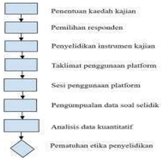
Rajah 1. Carta Alir Intervensi dan Penilaian Platform Qalbu Verse .

Rajah 1 merangkumi keseluruhan proses penyelidikan yang dilaksanakan secara berstruktur. Kajian ini bertujuan menilai persepsi terhadap keberkesanan platform Qalbu Verse sebagai medium pembelajaran al-Quran dalam kalangan pelajar Tingkatan 2 di sebuah Sekolah Menengah Harian di daerah Kuala Nerus (Suraini Saufi et al., 2023). Pendekatan ini dipilih bagi memperoleh data yang objektif dan berangka berkaitan pengalaman penggunaan platform tersebut dalam proses pembelajaran.